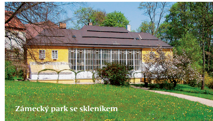
Zámecký park se skleníkem

Za vodním náhonem v sousedství Rudrova mlýna se nachází tato technická památka z první poloviny 19. století.