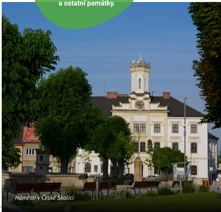
Náměstí v České Skalici

Na malém území tak můžete navštívit ratibořický zámek, historický mlýn, Staré bělidlo i obdivovat Viktorčin splav a ostatní památky.