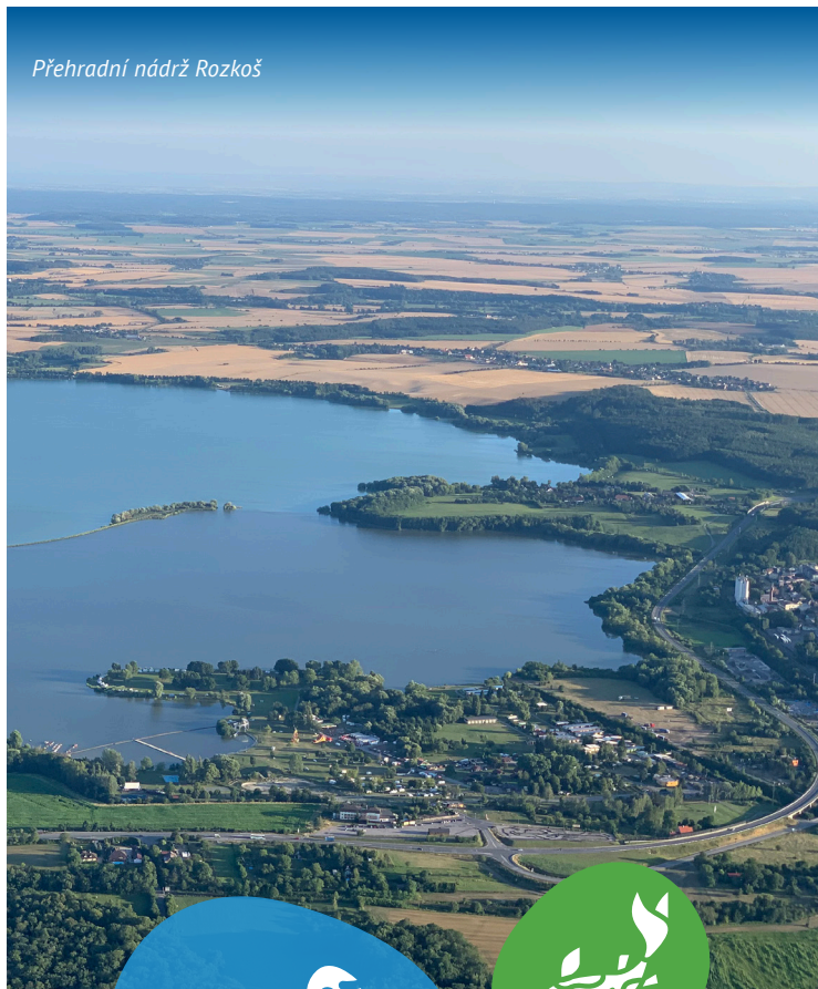
Přehradní nádrž Rozkoš