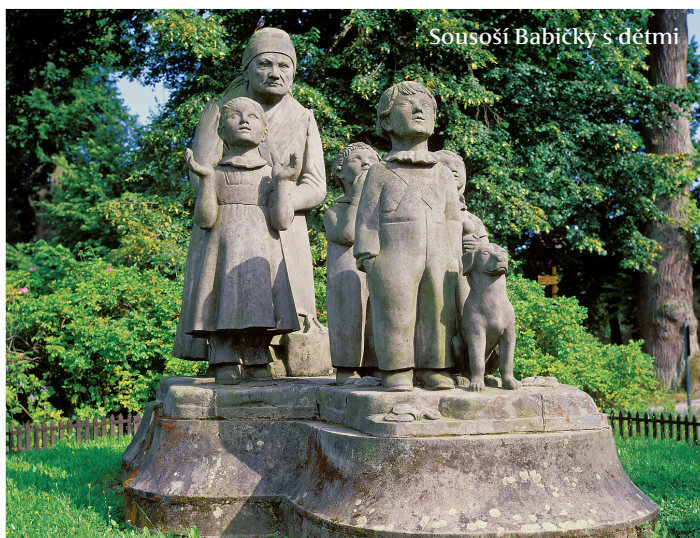
Sousoší Babičky s dětmi

Dnešní Česká Skalice má přes 5000 obyvatel, v letních měsících se s přílivem turistů toto číslo dvojnásobí. Kromě přírodních krás, historických památek a památných míst spojených se jménem spisovatelky Boženy Němcové naleznete v České Skalici a okolí mnoho zajímavých míst k odpočinku i vhodných míst ke sportovním výkonům. Město protíná několik atraktivních cyklotras, řada turisticky značených cest. V blízkém okolí najdete několik naučných stezek.